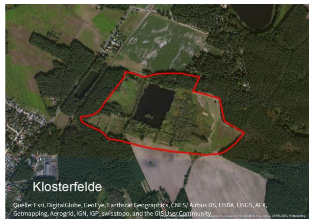
Naturschutzgebiet Torfstich Klosterfelde

Das Naturschutzgebiet Torfstich Klosterfelde liegt nordöstlich von Klosterfelde rund zwanzig Kilometer nordwestlich von Bernau.