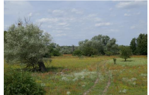
Langfristig könnte sich auch der Wiedehopf auf den Taufwiesenbergen wieder ansiedeln.

Durch Mahd oder Beweidung können die wald- und buschfreien Bereiche langfristig offen gehalten werden. Mit dem Entzug von Biomasse bleibt der nährstoffarme Charakter der Flächen erhalten. Aus diesem Grund hat die NABU-Stiftung ihre Flächen an einen Schäfer verpachtet.