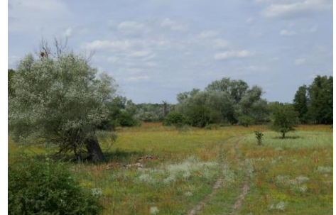
Langfristig könnte sich auch der Wiedehopf auf den Taufwiesenbergen wieder ansiedeln.

Durch Mahd oder Beweidung können die wald- und buschfreien Bereiche langfristig offen gehalten werden. Mit dem Entzug von Biomasse bleibt der nährstoffarme Charakter der Flächen erhalten. Aus diesem Grund hat die NABU-Stiftung ihre Flächen an einen Schäfer verpachtet.