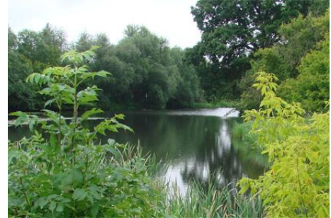
Ein abgeschnittener Altarm der Saale schlängelt sich entlang der Reiherkolonie Collenbey.

2006 erwarb die NABU-Stiftung südlich des Naturschutzgebietes bei Meuschau 6,5 Hektar im ehemaligen „Lehmausstich nördlich der Leipziger Chaussee“. Die stillgelegten Tongruben sind Heimat des letzten Vorkommens der Rotbauchunke im südlichen Sachsen-Anhalt und drohten zu verlanden und zu verschatten. Nach Erwerb des Geländes konnte der NABU Kreisverband Merseburg-Querfurt die bestehenden Laichgewässer sanieren und neue Gewässer für die bedrohte Unke schaffen.