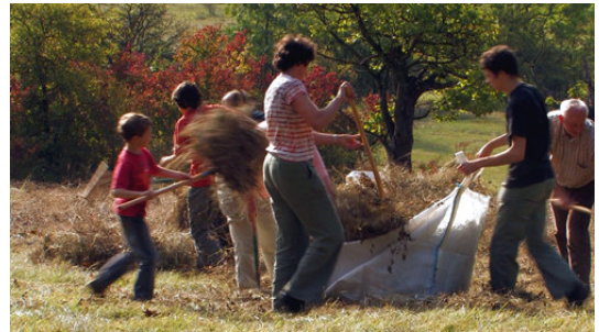
Einmal jährlich werden die sensiblen Orchideenwiesen an den Kalkhängen des Lichtersbergs mit großem Engagement vom NABU Saale-Holzland-Kreis gemäht.

Einen großen Teil der Wiesen hat die NABU-Stiftung an einen Schäfer verpachtet, der schon in dritter Generation den Übungsplatz mit seinen Schafen beweidet. Die Schafe verhindern durch ihren Verbiss die Verbuschung des Offenlandes und bewahren so den wertvollen Lebensraum für die ansässigen Pflanzen- und Tierarten. Die Wiesen mit den höchsten Orchideenvorkommen sind von der Beweidung ausgeschlossen und werden im Herbst durch die Ehrenamtlichen des NABU Saale-Holzland-Kreis vorsichtig per Hand gemäht, um die sensiblen Pflanzen zu schonen. Bei öffentlichen Führungen des NABU kann man die Blütenpracht und den Vogelreichtum im Frühsommer erleben. Für die bewaldeten Hänge sind keine Maßnahmen vorgesehen, da eine Pflegenutzung weder aus naturschutzfachlicher noch aus forstlicher Sicht notwendig ist. Die NABU-Stiftung hat ihren Wald komplett aus der Nutzung genommen, so dass die Wälder künftig ohne weitere Eingriffe Altbäume und Totholz aufbauen und damit an Strukturreichtum gewinnen können.