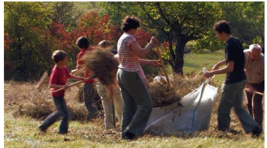
Einmal jährlich werden die sensiblen Orchideenwiesen an den Kalkhängen des Lichtersbergs mit großem Engagement vom NABU Saale-Holzland-Kreis gemäht.

Einen großen Teil der Wiesen hat die NABU-Stiftung an einen Schäfer verpachtet, der schon in dritter Generation den Übungsplatz mit seinen Schafen beweidet. Die Schafe verhindern durch ihren Verbiss die Verbuschung des Offenlandes und bewahren so den wertvollen Lebensraum für die ansässigen Pflanzen- und Tierarten. Die Wiesen mit den höchsten Orchideenvorkommen sind von der Beweidung ausgeschlossen und werden im Herbst durch die Ehrenamtlichen des NABU Saale-Holzland-Kreis vorsichtig per Hand gemäht, um die sensiblen Pflanzen zu schonen. Bei öffentlichen Führungen des NABU kann man die Blütenpracht und den Vogelreichtum im Frühsommer erleben. Für die bewaldeten Hänge sind keine Maßnahmen vorgesehen, da eine Pflegenutzung weder aus naturschutzfachlicher noch aus forstlicher Sicht notwendig ist. Die NABU-Stiftung hat ihren Wald komplett aus der Nutzung genommen, so dass die Wälder künftig ohne weitere Eingriffe Altbäume und Totholz aufbauen und damit an Strukturreichtum gewinnen können.