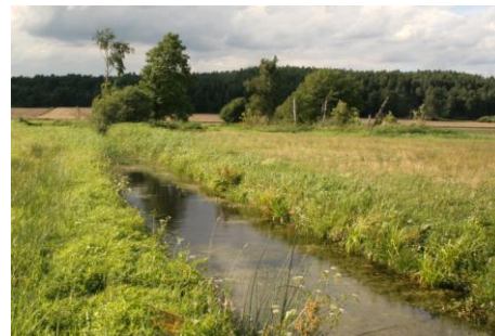
Blick über das Feuchtgrünland des Marzahner Fenn

Da die Traubenkirsche sich bereits stark ausgebreitet hat und ihre Samen durch Vögel schnell weitergetragen werden, sind Maßnahmen zur weiteren Einschränkung bzw. Beseitigung der Baumart gegenwärtig nur noch bei einem abgestimmten Vorgehen aller Flächeneigentümer des Gebietes sinnvoll. Waldbaulich ist daher auf den Stiftungsflächen eine Förderung der einheimischen Eiche oberstes Ziel. Hierfür können Gatter gegen den Wildverbiss aufgestellt oder Eichen im Voranbau gepflanzt werden. Eine vorsichtige Auflichtung der Kiefernbestände kann die Umwandlung zu einem naturnahen Eichen-Laubmischwald beschleunigen.