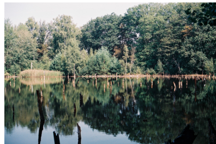
Der Luisensee, eines von mehreren Grubengewässern des früheren Braunkohlebergwerks, darf sich in Stiftungsobhut vom Menschen ungestört entwickeln.

Eine kleinere Stiftungsfläche außerhalb des Naturschutzgebietes ist geprägt durch Fichten, die an diesem Standort nicht lebensraumtypisch sind. Die NABU-Stiftung beabsichtigt hier einen Waldumbau hin zu einem standorttypischen Laubmischwald.