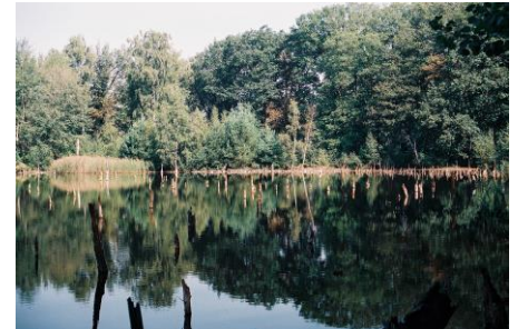
Der Luisensee, eines von mehreren Grubengewässern des früheren Braunkohlebergwerks, darf sich in Stiftungsobhut vom Menschen ungestört entwickeln.

Eine kleinere Stiftungsfläche außerhalb des Naturschutzgebietes ist geprägt durch Fichten, die an diesem Standort nicht lebensraumtypisch sind. Die NABU-Stiftung beabsichtigt hier einen Waldumbau hin zu einem standorttypischen Laubmischwald.