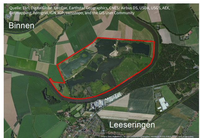
Das Naturschutzgebiet „Liebenauer Gruben“

Das Gebiet befindet sich im Landkreis Nienburg/Weser in Niedersachsen. Es liegt etwa fünf Kilometer westlich der Stadt Nienburg linksseitig der Weser.