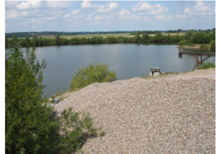
In der Zukunft werden hier naturnahe Auenwaldgesellschaften entstehen, die bundesweit zu den am stärksten bedrohten Biotoptypen zählen.

Durch regelmäßige naturkundliche Führungen des NABU Nienburg ist eine naturverträgliche Erkundung des Gebietes für Besucher möglich. Seit 2013 eröffnet eine barrierefreie Aussichtsplattform einen guten Blick auf die Gewässer und den Fischadlerhorst.