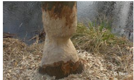
Die Spuren des Bibers sind im Königsfließ für den aufmerksamen Beobachter nicht zu übersehen. Ob Baumeister Biber hier auf Dauer Revier bezieht, wird sich in den nächsten Jahren zeigen.

Ihre Waldflächen hat die NABU-Stiftung aus der forstwirtschaftlichen Nutzung genommen und der Naturentwicklung überlassen. Die Stiftungswälder entwickeln so eine eigene Dynamik durch Werden und Vergehen. Alt- und Totholz dient ausschließlich als Lebensgrundlage einer Vielzahl von Tieren, Pflanzen, Pilzen und Flechten.