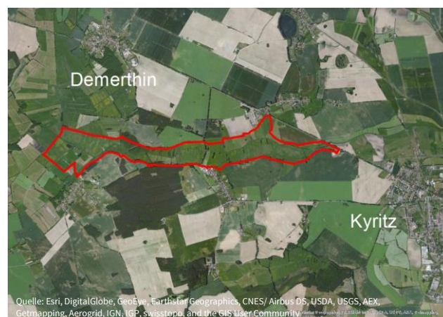
Naturschutzgebiet Königsfließ mit Lage in Brandenburg

Das Naturschutzgebiet Königsfließ liegt etwa zwei Kilometer westlich der Stadt Kyritz zwischen den Dörfern Demerthin, Berlitt, Rehfeld und Mechow.