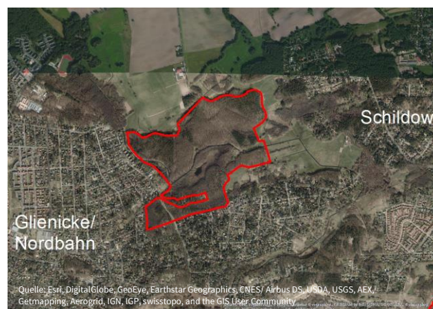
Das Naturschutzgebiet „Kindelsee-Springluch“

Das Naturschutzgebiet gehört zu den Gemeinden Glienicke/Nordbahn und Schönfließ am nördlichen Rand von Berlin.