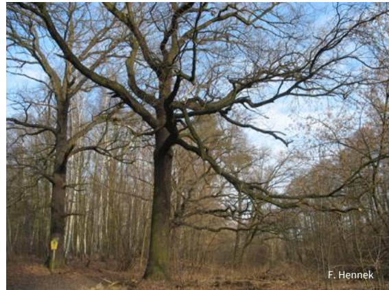
Alte Huteeichen zeugen von der Waldweide vergangener Jahrhunderte.

Zur Ergänzung ihrer Flächen bemüht sich die NABU-Stiftung um den Erwerb des Kindelsees, der ebenfalls dem Prozessschutz unterstellt werden soll.