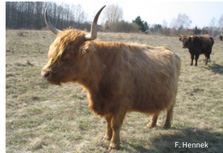
Eine Mischherde aus Hochlandrindern (s. Bild) sowie Heckrindern wird zur Landschaftspflege eingesetzt.

Im Schutzgebietsteils „Lange Dammwiesen und Unteres Annatal“ setzt sich der NABU Strausberg-Märkische Schweiz seit 2001 mit einem Beweidungsprojekt für den Erhalt einer vielfältigen Offenlandschaft ein. Von dem halboffenen Weidesystem mit sehr geringem, aber ganzjährigem Tierbesatz profitieren insbesondere Wiesenbrüter wie z. B. der Wachtelkönig. Auch der stark gefährdete Große Feuerfalter und zahlreiche andere seltene Schmetterlingsarten finden durch das naturschonende Grünlandmanagement wertvollen Lebensraum. Die NABU-Stiftung hat ihre in diesem Bereich liegenden Wiesenflächen in das extensive Beweidungs- und Grünlandmanagement eingegliedert und hierfür an ortsansässige Landwirte verpachtet.