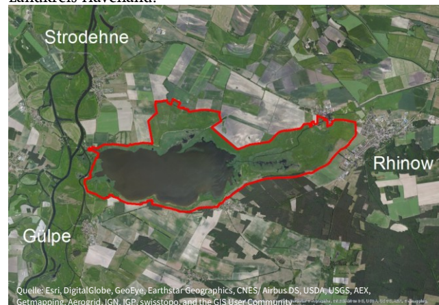
Naturschutzgebiet Gülper See

Das Naturschutzgebiet Gülper See liegt im Naturpark Westhavelland, etwa 30 Kilometer nordöstlich von Stendal im Landkreis Havelland.