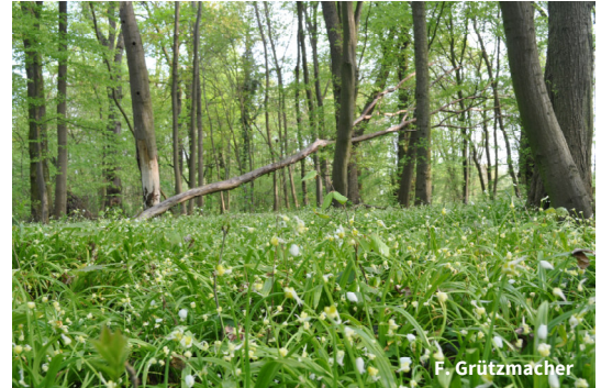
Der ehemalige Schlosspark von Fredersdorf ist für Besucher frei zugänglich. Mit Fledermauskästen, Anlage von Totholzhaufen und Beobachtungen zur Vogelwelt setzt sich die NABU-Ortsgruppe für die Natur des ehemaligen Parks ein.

Mit den bundeseigenen Flächen wurde der NABU-Stiftung auch der Standort einer ehemaligen Polstermöbelfabrik übertragen, der weit in das Fließ hineinreichte. Durch den Abriss des Stahlaufbaus samt Bodenplatte sowie der Entfernung des umliegenden Abfalls in den Jahren 2012-2014 konnte die NABU-Stiftung das Schutzgebiet an dieser Stelle deutlich aufwerten.