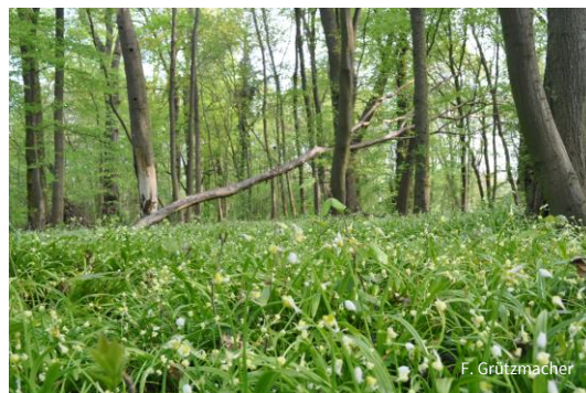
Der ehemalige Schlosspark von Fredersdorf ist für Besucher frei zugänglich. Mit Fledermauskästen, Anlage von Totholzhaufen und Beobachtungen zur Vogelwelt setzt sich die NABU-Ortsgruppe für die Natur des ehemaligen Parks ein.

Mit den bundeseigenen Flächen wurde der Standort einer ehemaligen Polstermöbelfabrik übertragen, der weit in das Fließ hineinreichte. Durch den Abriss des Stahlaufbaus samt Bodenplatte sowie der Entfernung des umliegenden Abfalls in den Jahren 2012-2014 konnte die NABU-Stiftung das Schutzgebiet an dieser Stelle deutlich aufwerten.