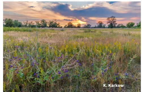
Feucht- und Auengrünland nimmt den Großteil der Fläche der Elbaue bei Werben ein. Die Wiesen und Weiden werden extensiv genutzt und gepflegt. Sie sind wertvolle Lebensräume für zahlreiche Pflanzenarten und Insekten.

Durch weitere Käufe will die NABU-Stiftung in den kommenden Jahren ein in sich geschlossenes Stiftungsgebiet in der Elbaue bei Werben aufbauen.